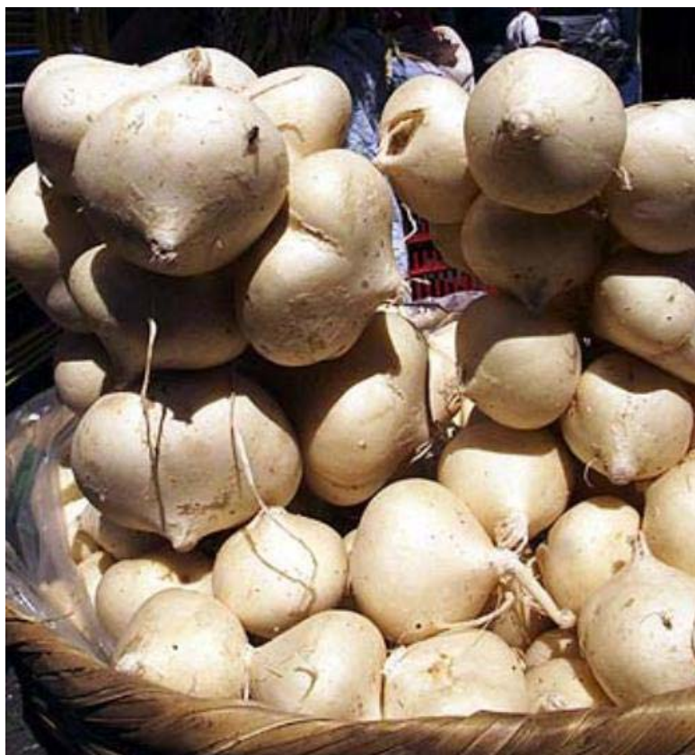
Raíces tuberosas de ahípa para su comercialización

En medicina tradicional se usa la decocción de la raíz como diurético, la pasta de la pulpa, fresca molida y calentada en aceite de almendras, se usa para aliviar las afecciones de la piel, y la cáscara deshidratada de la raíz pulverizada las utilizan contra la rinitis y el dolor de cabeza.