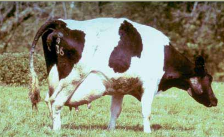
Vaca lechera con las ubres dilatadas

Existen alrededor de 200 millones de vacas lecheras en todo el mundo, las cuales producen unos 500 millones de toneladas de leche al año. La cría selectiva ha provocado un aumento espectacular en la productividad, por lo que en la actualidad las vacas pueden llegar a producir más de 40 litros de leche diarios. Dichos niveles de producción requieren una enorme demanda fisiológica por parte de las vacas, lo que genera graves consecuencias para su bienestar.