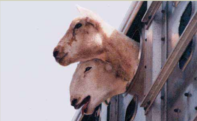
Luchando para respira

Antes de ser sacrificados, muchos animales de granja deben sufrir largos viajes, durante los cuales el agotamiento, la deshidratación y la tensión va en aumento. Algunos sufren agresiones e incluso pueden llegar a ser pisoteados por sus compañeros. En el peor de los casos, muchos mueren. Por ejemplo, en el año 2001, se importaron alrededor de seis millones de ovejas vivas de Australia a Oriente Medio. El viaje pudo tener una duración de hasta tres días hasta llegar a puerto y, una vez allí, las ovejas tuvieron también que soportar el transporte marítimo, que puede durar hasta un máximo de tres semanas. Durante dicho año, alrededor de 85.000 ovejas murieron a causa del transporte marítimo. CIWF Trust se manifiesta en contra del transporte de animales vivos a larga distancia, el cual debería ser sustituido por la comercialización de carne