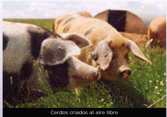
Cerdos criados al aire libre

CIWF Trust cree que debería haber una producción alimenticia sostenible a nivel económico, social y medioambiental, que no comprometiera el bienestar de los animales. La cría intensiva de animales debería ser remplazada por sistemas de cría