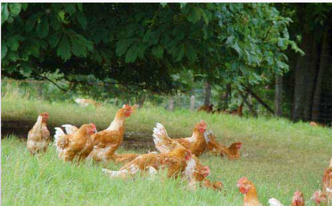
Pollos de engorde criados al aire libre

CIWF Trust cree que debería haber una producción alimenticia sostenible a nivel económico, social y medioambiental, que no comprometiera el bienestar de los animales. La cría intensiva de animales debería ser remplazada por sistemas de cría