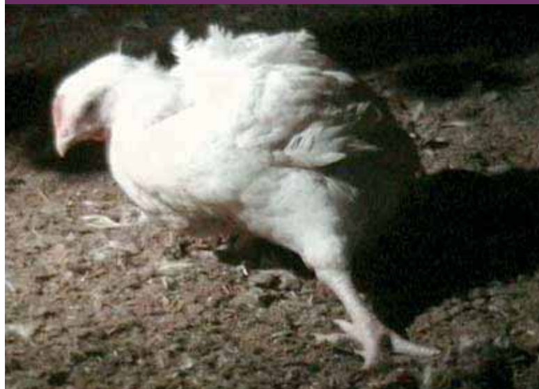
Pollo de engorde sufriendo de una dolorosa cojera

Alrededor de 45 billones de pollos de engorde son sacrificados anualmente por su carne en todo el mundo. Aproximadamente la mitad de ellos se crían en sistemas industriales, mediante los cuales decenas de miles de aves se amontonan en naves enormes. El suelo de dichas naves enseguida se ensucia y humedece con el amoníaco de los excrementos de las aves, que pueden llegar a provocarles ampollas en el pecho, quemaduras en el corvejón y úlceras en las patas. Asimismo, el hacinamiento genera graves problemas de bienestar, como resultado de la inactividad y del estrés producido por las altas temperaturas. En algunos países, los pollos de engorde se crían en jaulas semejantes a las utilizadas con las gallinas ponedoras.