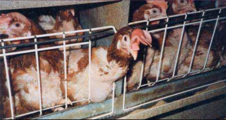
Gallinas abarrotadas dentro las jaulas en batería

En la actualidad, existen cerca de cinco billones de gallinas ponedoras en el mundo, que producen anualmente unos 50 millones de toneladas de huevos. Las razas modernas de gallinas producen alrededor del doble de huevos de lo que producían hace 50 años, cada gallina pone una media de 300 huevos anuales. Los pollitos macho suelen ser sacrificados nada más nacer, puesto que se considera que criarlos para aprovechar su carne no resulta económicamente rentable. Las hembras destinadas a la cría intensiva se amontonan en pequeñas jaulas junto con otras muchas antes de que empiecen a poner huevos, hacia las 18 semanas de edad. Dichas jaulas se distribuyen en filas que alcanzan hasta 8 pisos de profundidad en naves enormes.